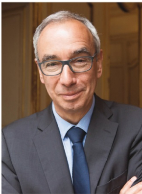
Jean Pisani-Ferry Commissaire général de France Stratégie

À la suite de l'adoption du plan pluriannuel de lutte contre la pauvreté et pour l'inclusion sociale, le Premier ministre a demandé à France Stratégie de constituer une commission chargée d'élaborer une stratégie nationale pour l'enfance et l'adolescence.